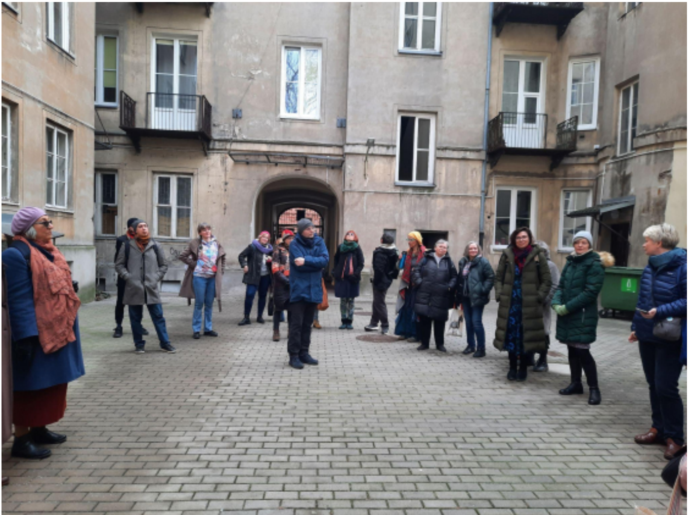
Ho?a 74, zdj?cie ze spaceru „Siedziba etnologii niejedno mia?a imi?... ” 26.02.2025