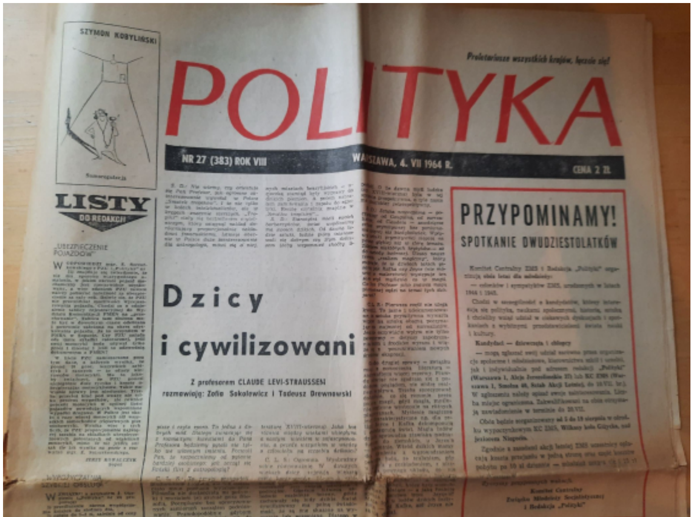
Wywiad z Claude Lévi-Straussem, 1964, fot. Archiwum IEiAk UW