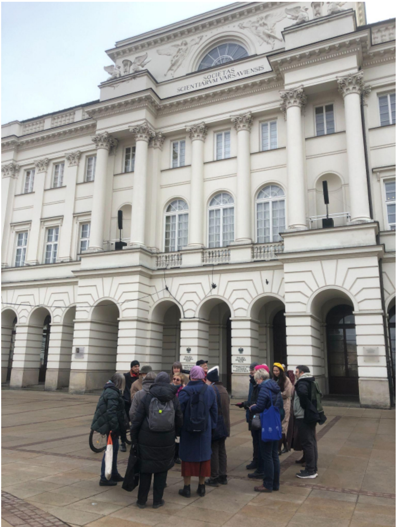
Pa?ac Staszica, zdj?cie ze spaceru „Siedziba etnologii niejedno mia?a imi?... ” 26.02.2025