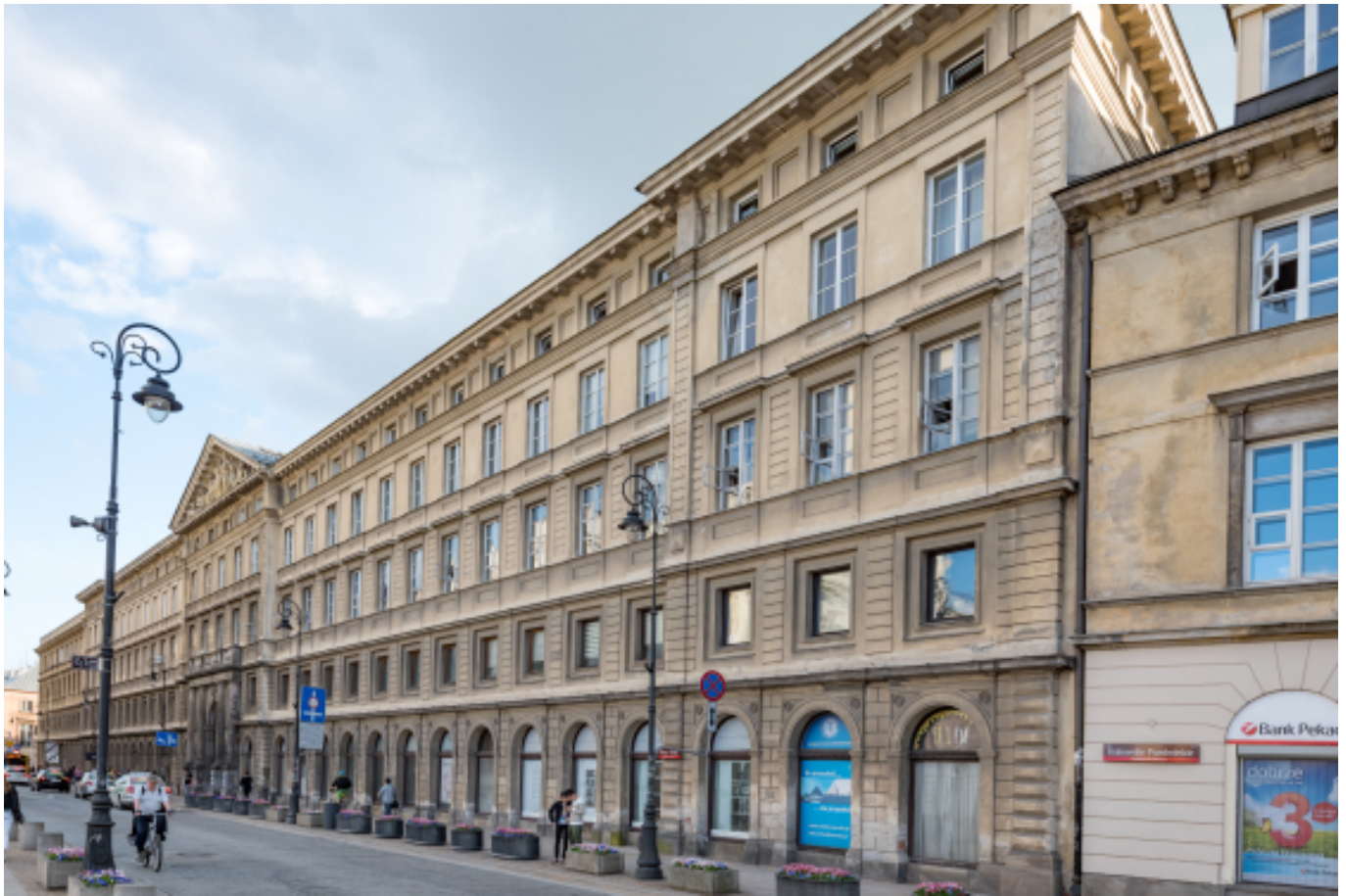
Nowy ?wiat 69, https://pl.m.wikipedia.org/wiki/Plik:Warszawa,_ul._Nowy_%C5%... [30]