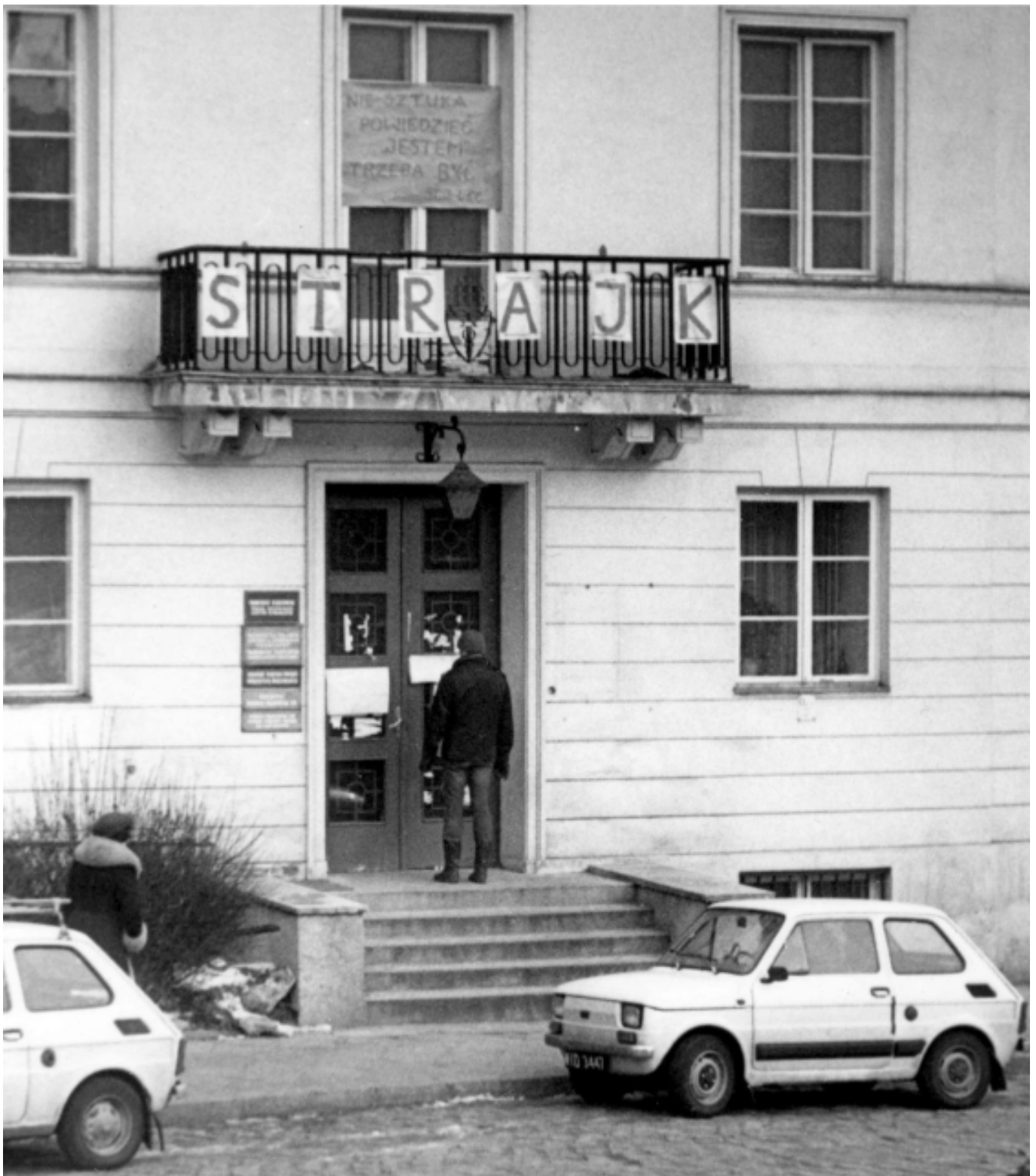
Obo?na 8, zdj?cie ze strajku studenckiego, listopad 1981