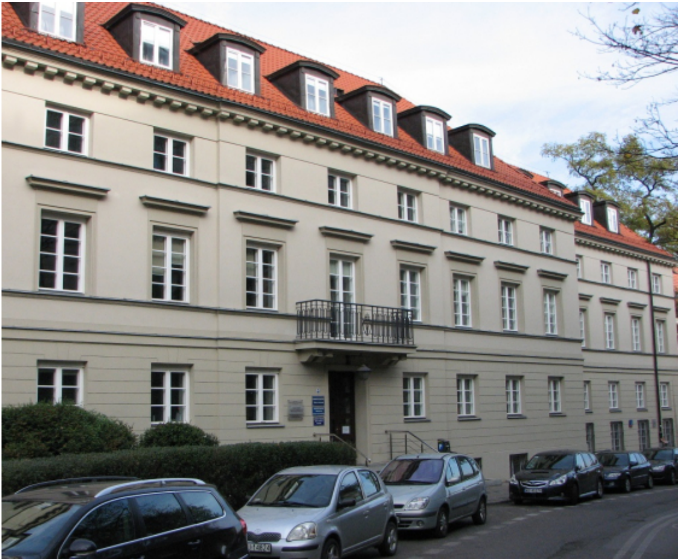
Obo?na 8, obecnie, https://pl.m.wikipedia.org/wiki/Plik:Dom_Kupca,_ul._Obo%C5%B... [31]