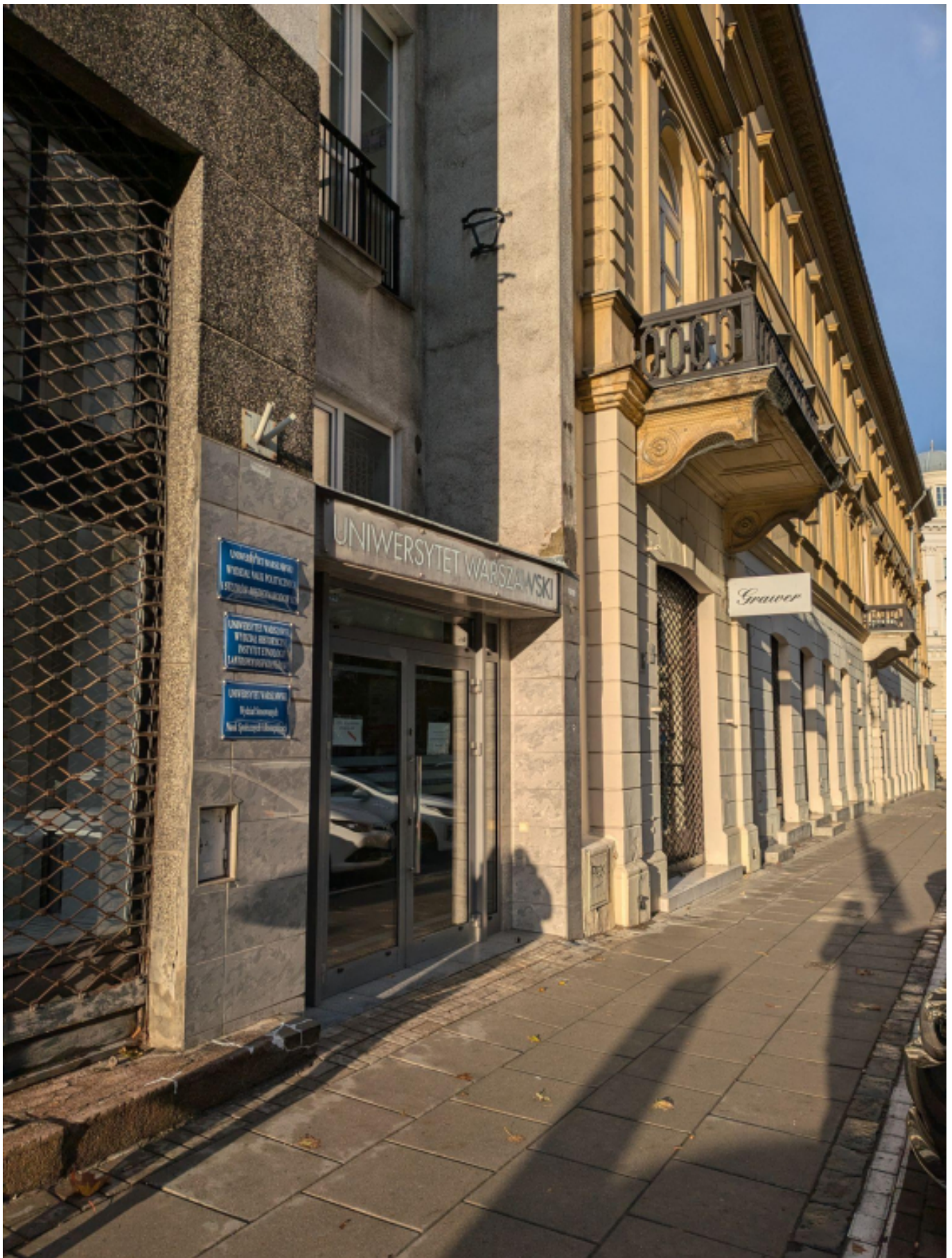
Warszawa 4, 2024