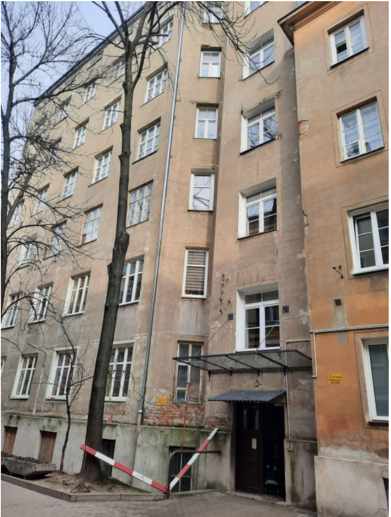
Ho?a 74, zdj?cie ze spaceru „Siedziba etnologii niejedno mia?a imi?... ” 26.02.2025