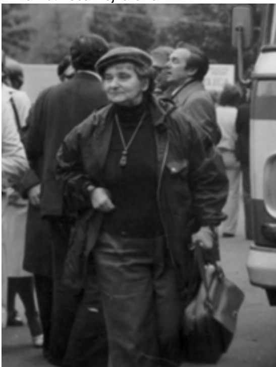
A. Kutrzeba-Pojnarowa, Archiwum IEiAK UW