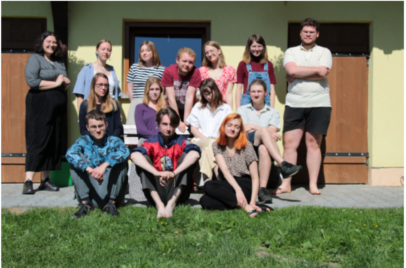
Grupa laboratoryjna Dziedzictwo na pograniczu - Chochołów.

MAPA BADA? - autorki: Ewa Winiarczyk i Jadwiga Mik