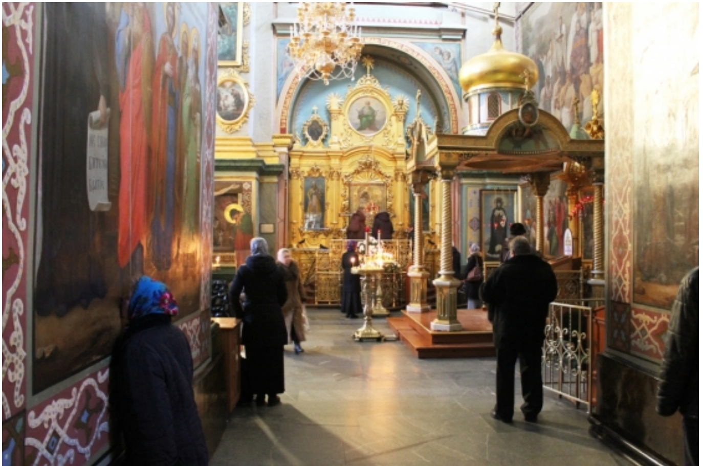
Sobór Za?ni?cia Matki Bo?ej

Badania prowadzone w ramach projektu pozwalaj? opisa? zró?nicowane praktyki podejmowane wobec obiektów materialnych uznawanych za uzdrawiaj?ce lub cudowne, a tak?e uchwyci?, jak konceptualizowana i praktykowana jest ich sprawczo??. Praktyki podejmowane przez wiernych odwiedzaj?cych Poczajów interpretowane s? w szerszym kontek?cie praktyk i dyskursów zwi?zanych ze zdrowiem i religi? na Ukrainie Zachodniej.