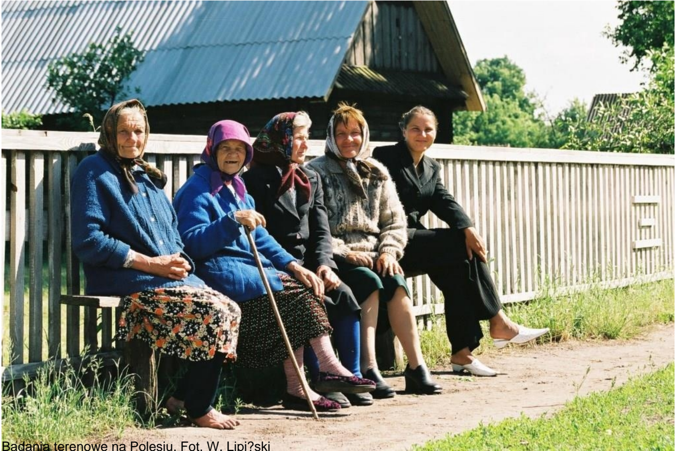
Badania terenowe na Polesiu.

Laboratorium etnograficzne to zajęcia charakterystyczne dla naszego instytutu, pozwalające na wyjątkowe uczenie się w działaniu. Jest to specyficzna, intensywna i długotrwała forma zajęć, skoncentrowana wokół konkretnego problemu badawczego, trwająca od połowy pierwszego do połowy trzeciego roku studiów licencjackich.