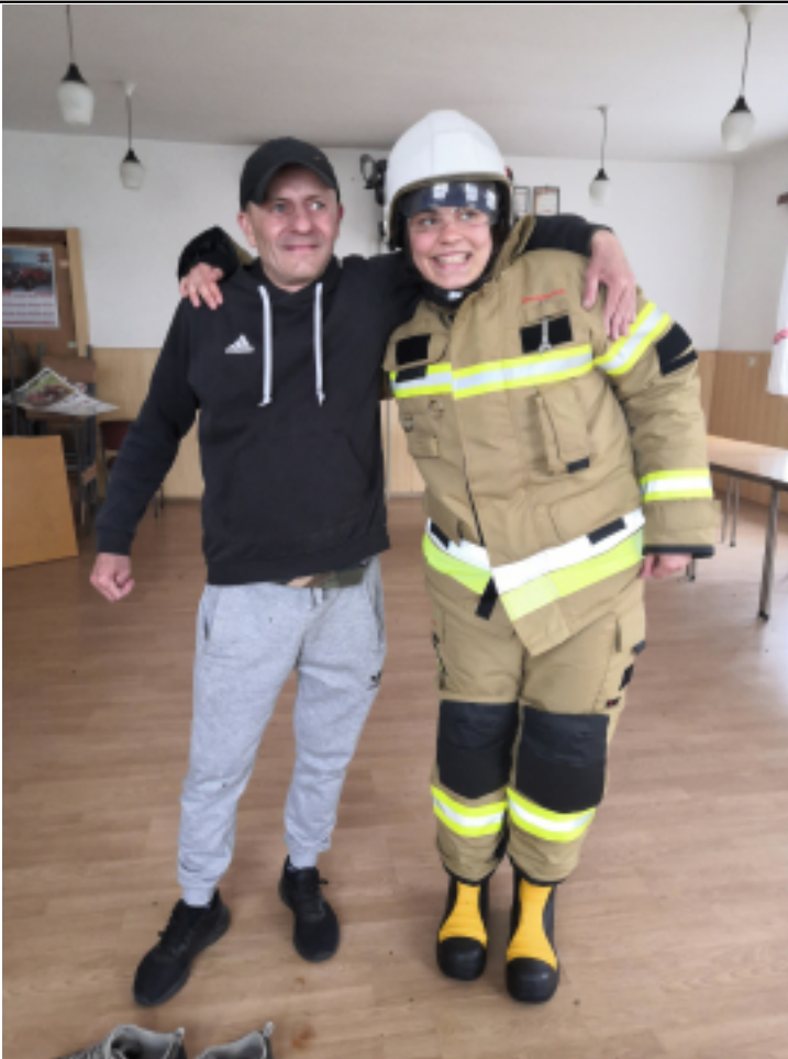
Spotkanie w OSP ?urawin, pow. sierpecki.

Laboratorium podejmuje następujące tematy: