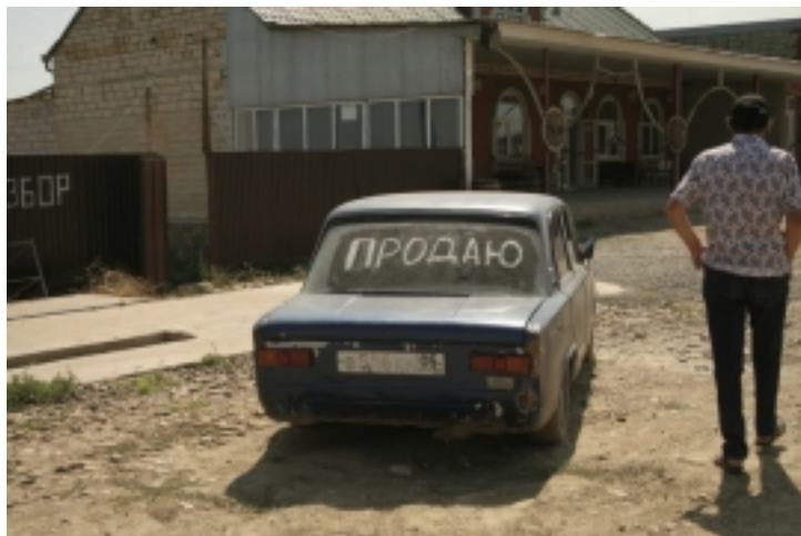
Pomoc lekarska w zamian za mi?d i jajka, matura za