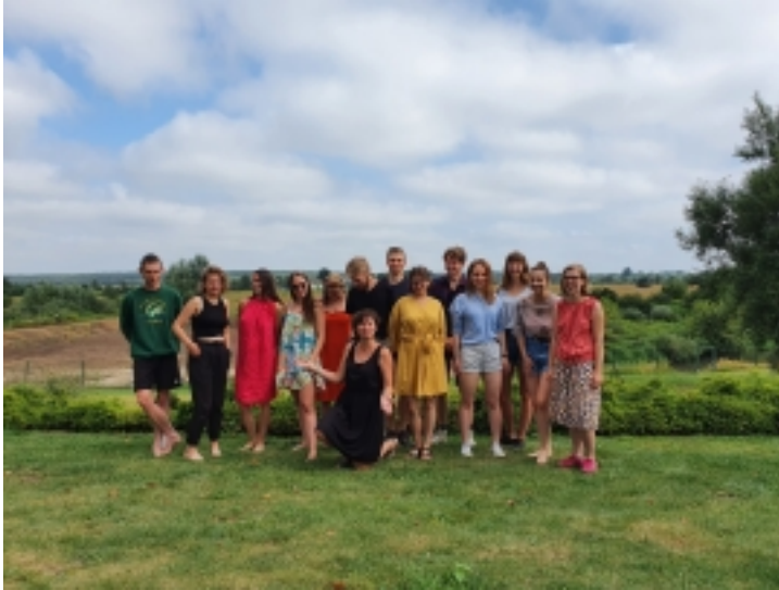
Badania terenowe grupy laboratoryjnej "Pamięć II wojny światowej i powojnia na Podkarpaciu - ujęcie antropologiczne"